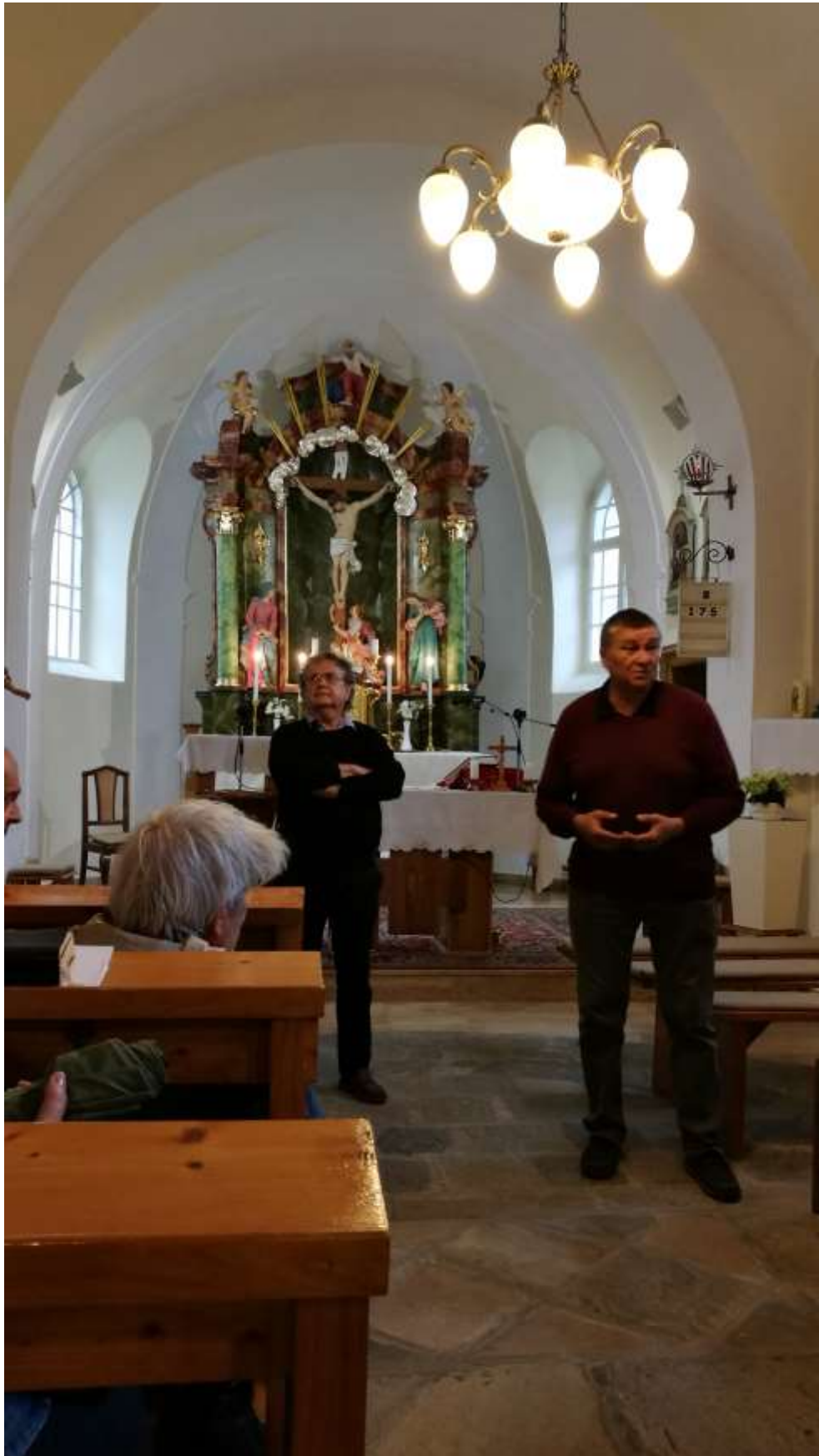
A nardai templom