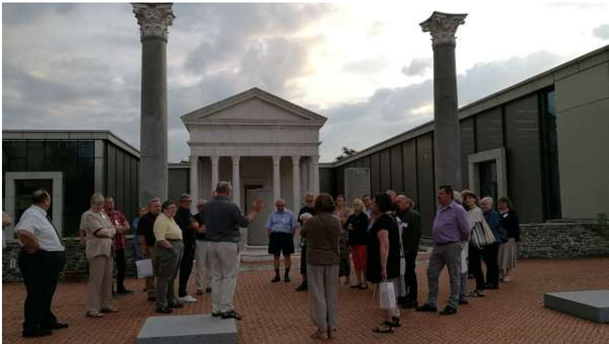
Tárlatvezetés az Iseumban II.