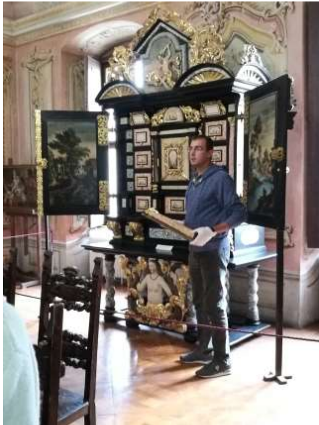
Sárvár-Nádasdy Ferenc Múzeum