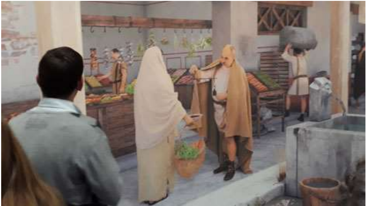
Római-terem, Savaria Múzeum/Szombathely