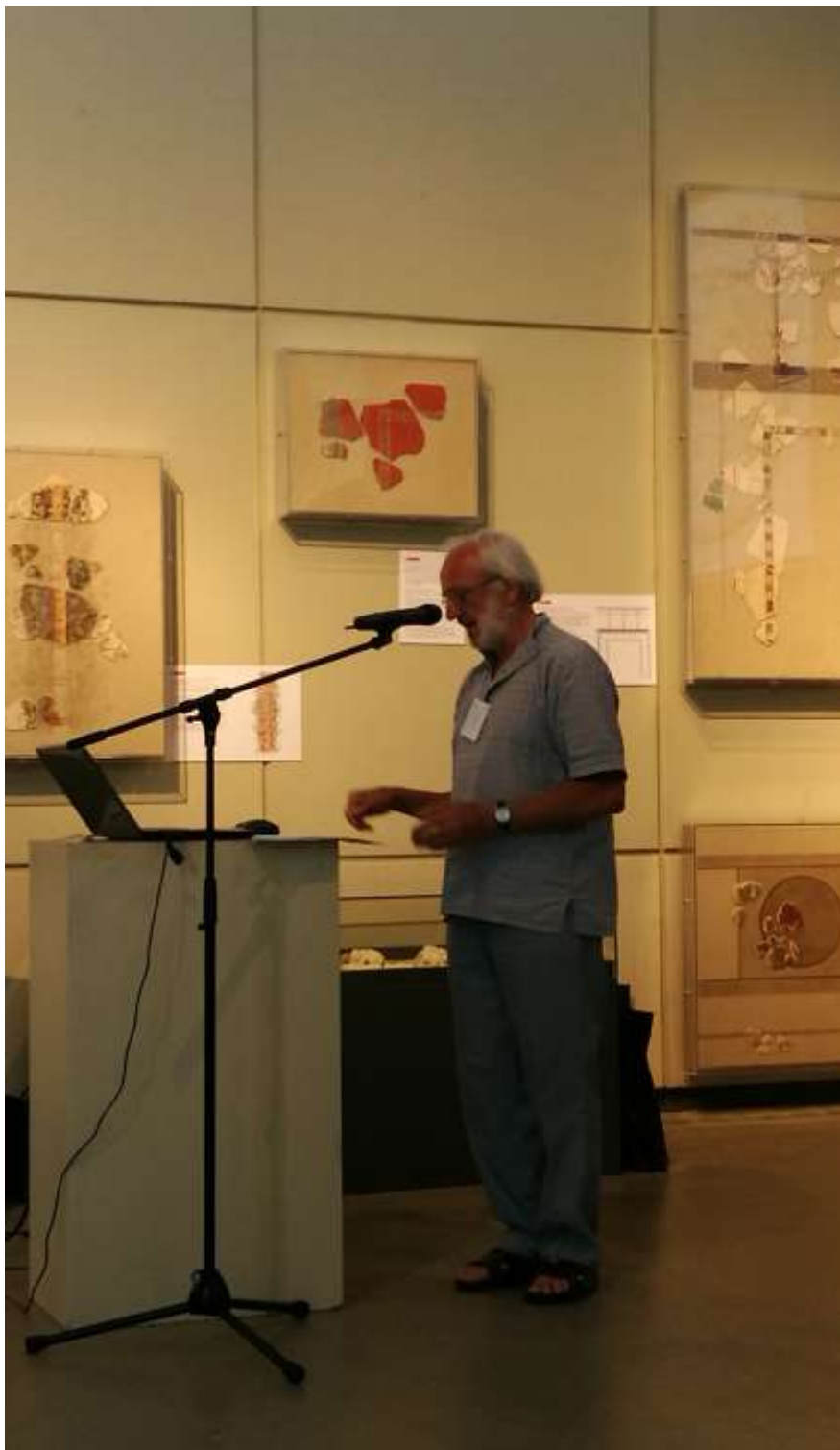
Konferencia az Iseumban