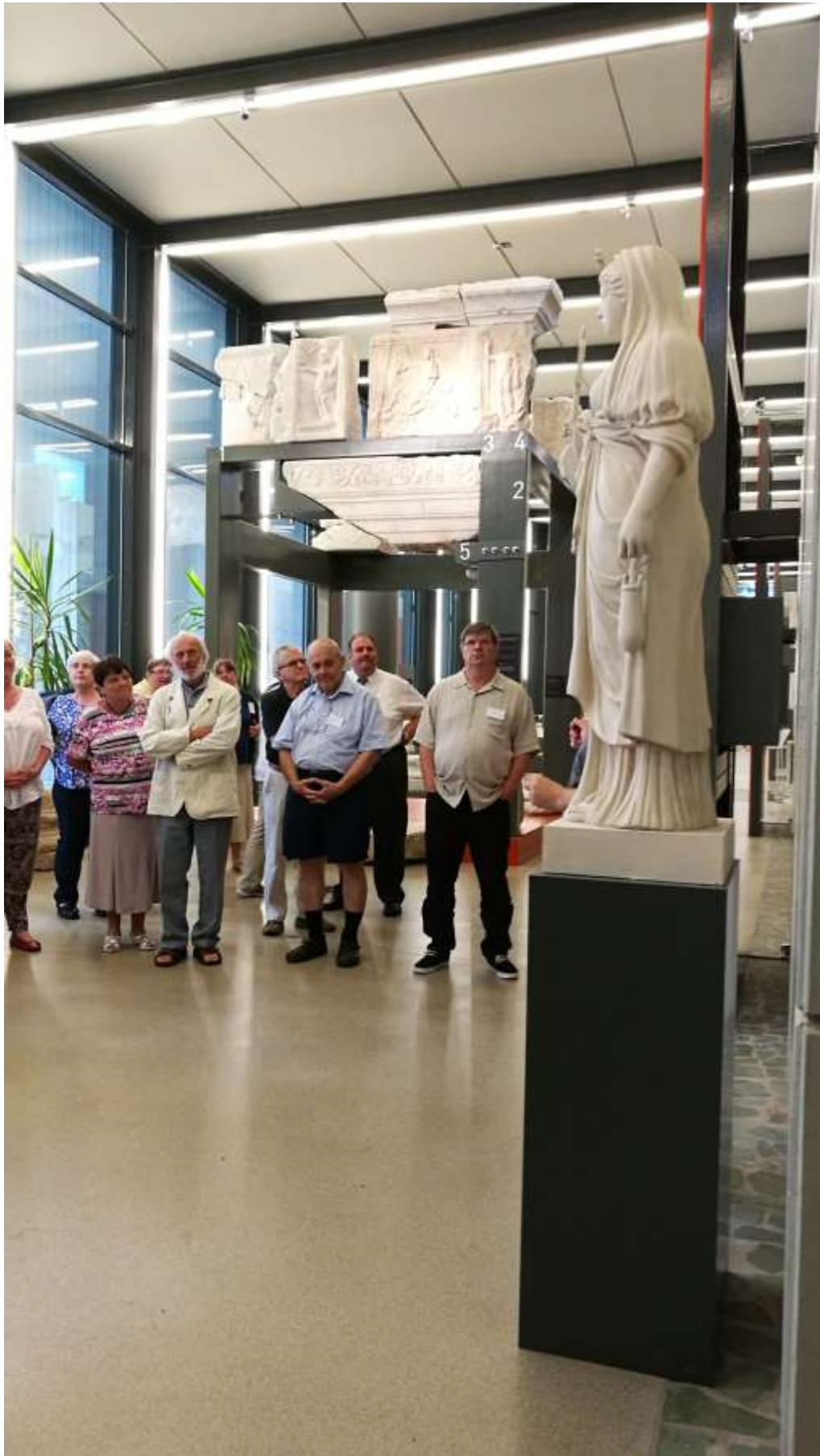
Tárlatvezetés az Iseumban